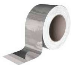
ALU BAND page 61