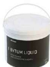
BYTUM LIQUID page 48