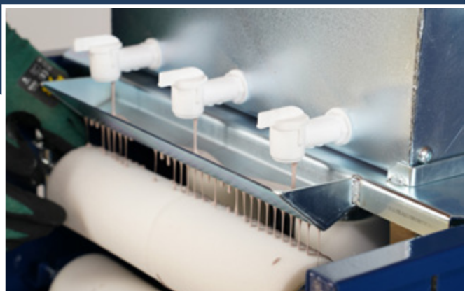
Prácticos grifos que permiten regular la cantidad de color para impregnar los rodillos* de esponja.