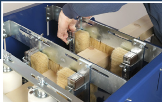
Calibración de los cepillos* para un óptimo acabado.