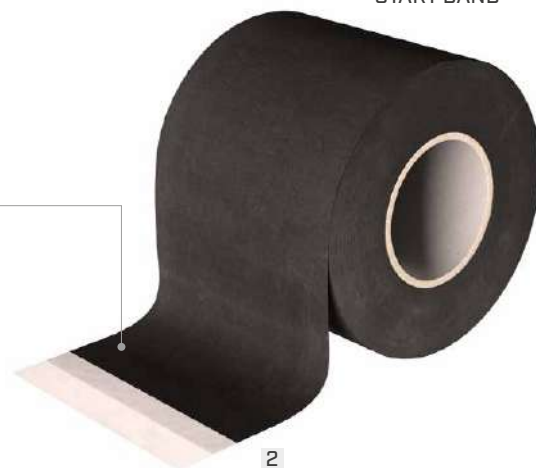
2 START BAND ADHESIVE