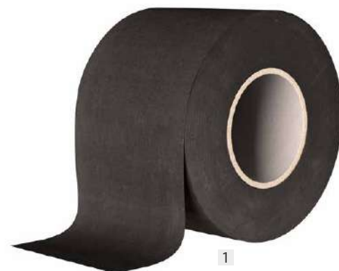
1 START BAND

suporte borracha sintética à base de EPDM